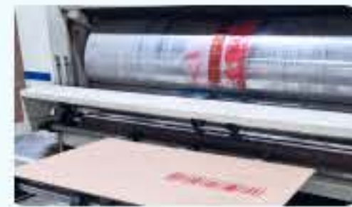
골판지 인쇄 (2도 가능)