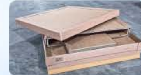
종이 파렛트 재활용폐기