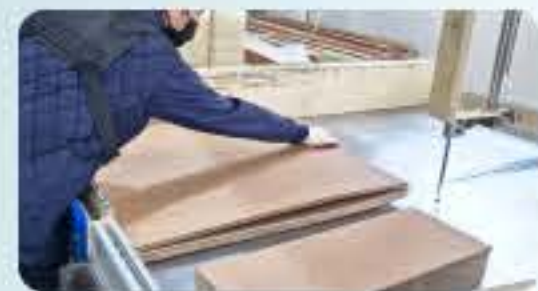
골판지재단 (상면, 하면, 측면)