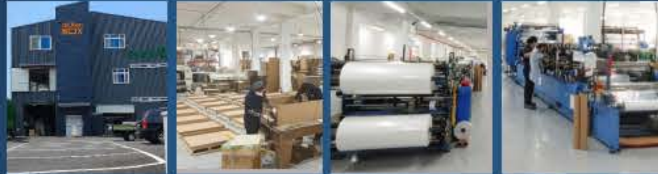
경기도 안산 소재 수출용 종이상자 에어셀 라인1 에어셀 라인2