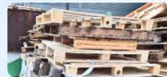
목재 파レット 처치곤란