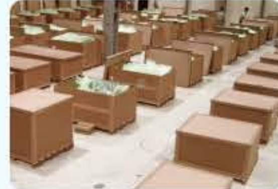
수출용 종이박스 포장작업